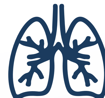
Dificultad para respirar