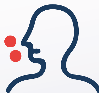
Pérdida del Gusto y Olfato